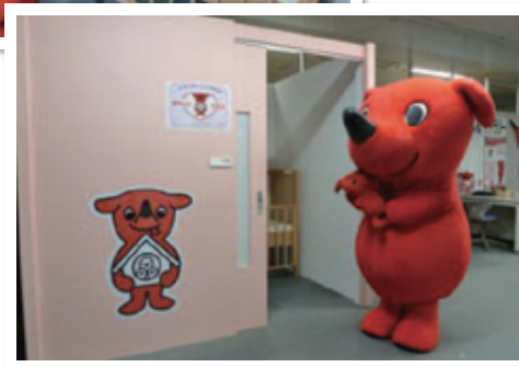
千葉県庁内に設置された「赤ちゃん休憩室」