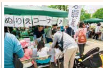
流山グリーンフェスティバルの様子

オープン日には、流山グリーンフェスティバルにご参加いただいた地域のお子さまの「ぬり絵」をロビーに展示いたしました。