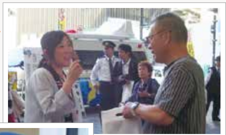
千葉駅前イベントの様子

成田支店には「ゆるキャラグランプリ」でご当地キャラクター日本一に輝いた「うなりくん」も来店し、イベントを盛り上げました。