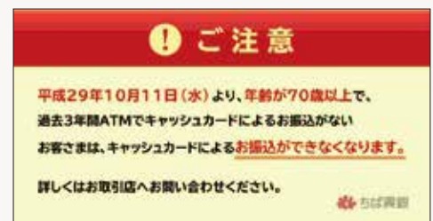
ATM画面でのお振込制限のお知らせ

ちば興銀では、ひとりでも多くのお客さまの大切な預金をお守りしたいという思いから、一部のお客さまについては、お振込を制限させていただくことにいたしました。