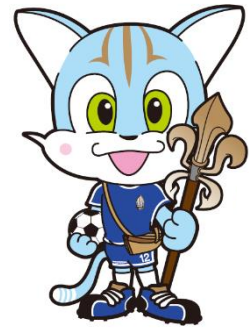
ブリオベッカ浦安 マスコットキャラクター 「舞田べか彦」