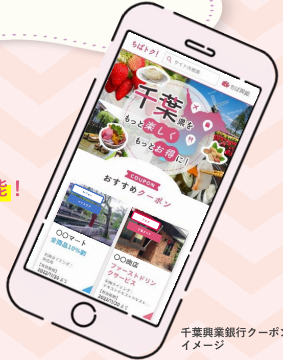
千葉興業銀行クーポンサイトイメージ

これまで「クーポンを掲載したことがない」「WEB広告を出稿したことがない」というお客さまも、簡単に無料で始められます。また銀行が運営するサイトであり安心です！