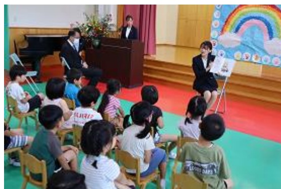
ちばコーギーの原案者である当行行員が絵本の読み聞かせをいたしました。

当行は、これからもSDGs達成への取組みを推進し、地域の経済・産業・社会の持続的な発展・繁栄に貢献してまいります。