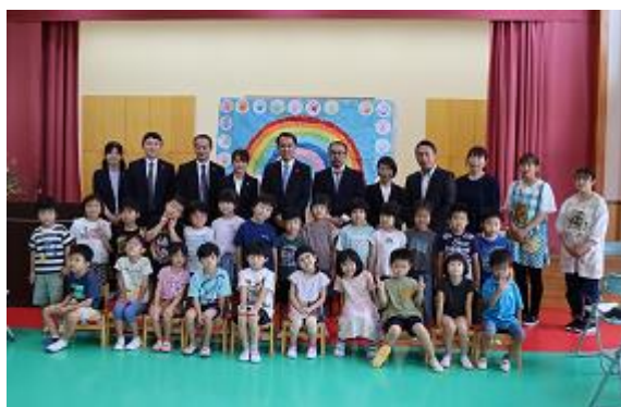
ちはら台東保育園のみなさん