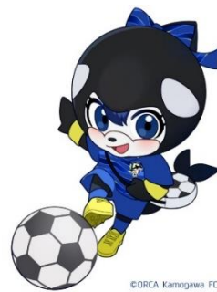
オルカ鴨川FC マスコットキャラクター 「オルリン」