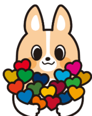
CHIBA CORGI × SDGs

当行は、SDGsの普及啓発・推進のため、当行イメージキャラクター ちばコーギーを使用した「CHIBA CORGI × SDGs」ロゴマークを作成いたしました。