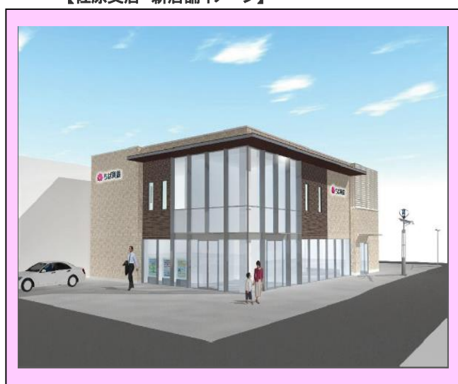
【佐原支店 新店舗イメージ】